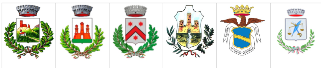
Comuni di Baiso - Casalgrande - Castellarano - Rubiera - Scandiano e Viano